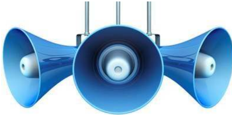
Dvosmjerni najsigurniji audio sustav

MPEG-4 Advanced Audio Coding (AAC) donosi novu razinu sigurnosti i frekvencijski odziv na nadzor. Cijenjeno od strane policije i tajnih nadzornih operacija diljem svijeta.