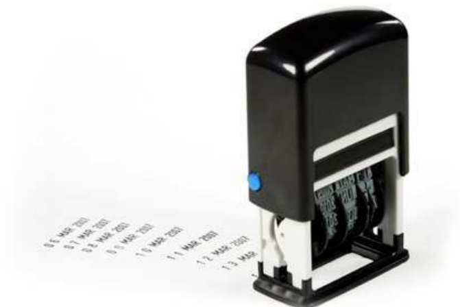
NTP u svakom dijelu hardvera

Imajte sve sinkronizirano prema svome glavnome satu, bez potrebe za dodatnim NTP poslužiteljem, osiguravajući dokaz točnom vremenskom ovjerom.