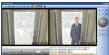
Synchronisation von Video- und Zutritts-Daten. | Synchronization of video and access-control data.