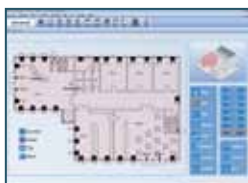
Moderne und individuelle Benutzeroberflächen. | Modern and individual user interfaces.