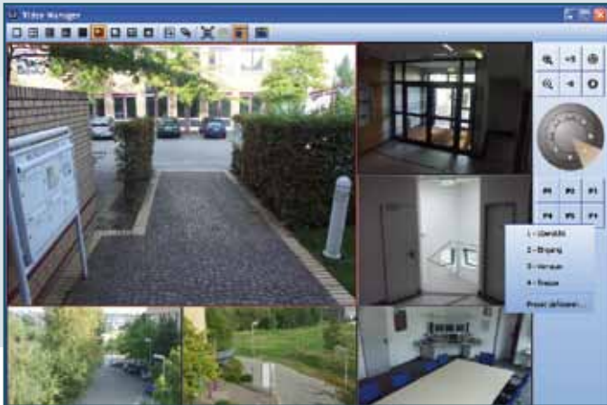
Der Videomanager ermöglicht die einheitliche Bedienung verschiedener angeschlossener Systeme. | The Videomanager offers a unified handling for all connected subsystems.

Close cooperation and continuous assistance are the key factors for the successful operation of a security and building management solution. The WinGuard partner concept ensures that qualified local partners convert particular requirements of the client into an individual security solution.