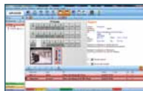
Störungsmanagement für Rechenzentren. | Fault report handling for data centers.