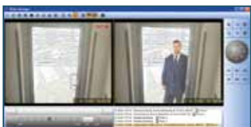
Synchronisation von Video- und Zutritts-Daten. | Synchronization of video and access-control data.