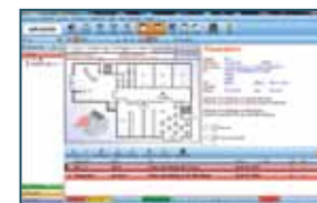
Übersichtliche Alarmbearbeitung. | Clear Alarm Handling Overview.