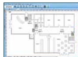
Mächtiger Grafikeditor und CAD-Grafik Import. | Powerful graphic editor and CAD graphic import.